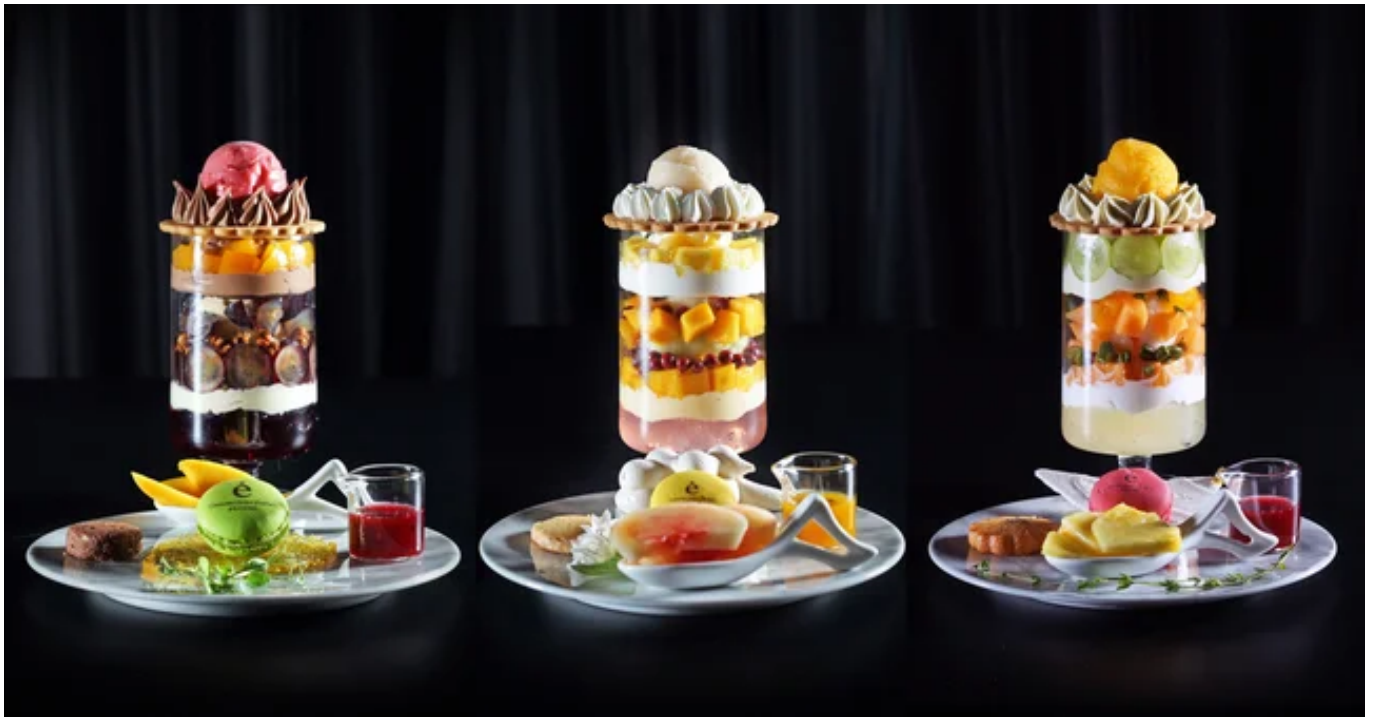
éGOISH∞ セットバリエーション例

スープ（5種）・フルーツ MID（7種）・クリーム MID（4種）・ゼリー（7種）、全15パーツ81種類から、お好きな組み合わせをセレクト。