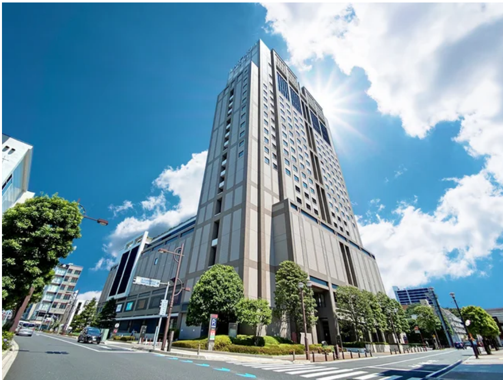
ロイヤルパインズホテル浦和