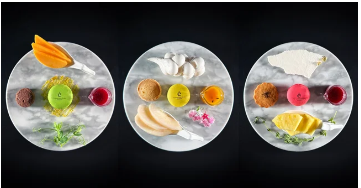
éGOISH∞ カスタムディッシュ例