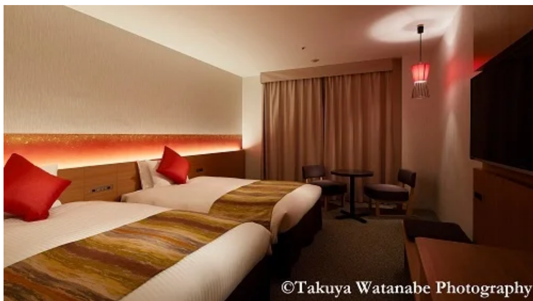
スーペリアツイン

『ロワジールホテルクラシックガーデン 京都三条』は、市営地下鉄烏丸線・東西線「烏丸御池」駅6番出口より徒歩1分、阪急京都線「烏丸」駅より徒歩7分の場所に位置する、地上9階、全169室のリブランドホテルです。世界遺産である二条城や京都御所にもほど近い、観光の拠点として大変便利な好立地ながら落ち着いた空間であることも特徴で、ロビーやレストラン、大浴場からは風情ある日本庭園の眺めをお楽しみいただけます。