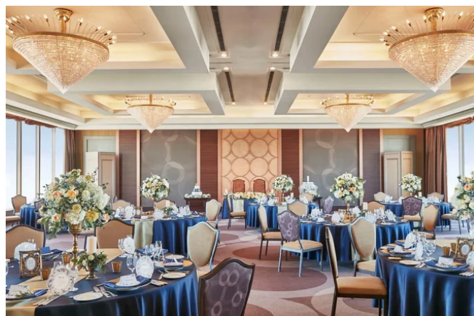
ロイヤルパインズホテル浦和 スカイバンケット

浦和駅より徒歩7分、都内・さいたまスーパーアリーナへのアクセスも便利なフルサービスホテル。