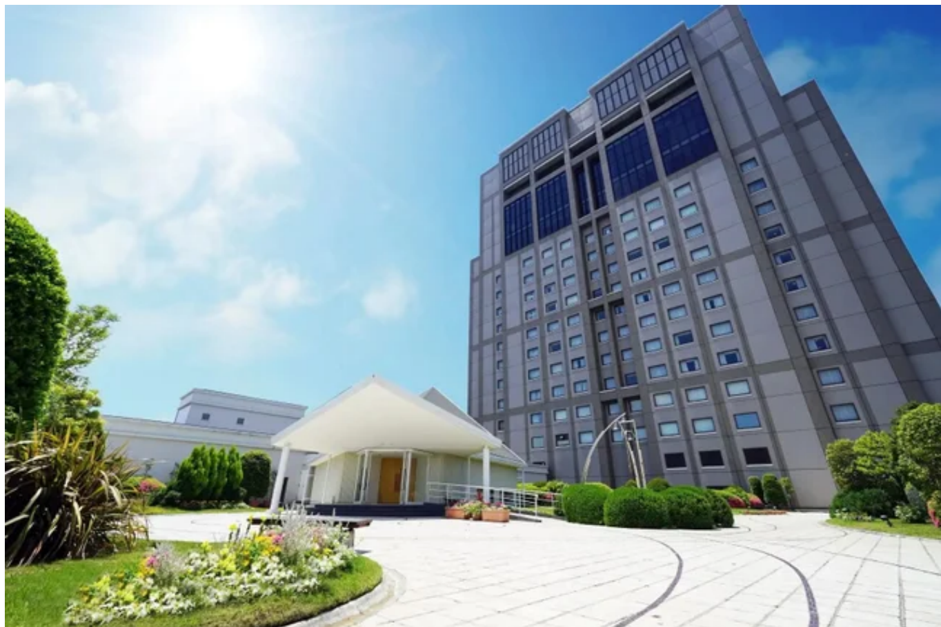
ロイヤルパインズホテル浦和 ガーデンチャペル