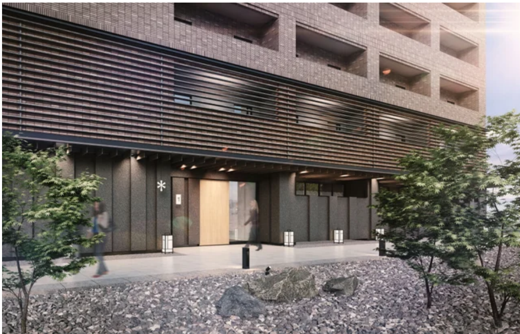
『暖雪 札幌』 外観イメージ

こだわりのサウナや大浴場、北海道の自然からうまれたアート、ラウンジなど、充実した施設を通じて、ほっとあたたまる特別なひとときをお届けします。